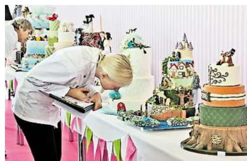
NICHT NUR GESCHMACKS-SACHE: Eine Jury bewertet die Torten.

➔ Die Sonderausstellung Cake World 2015 ist nur noch am heutigen Montag geöffnet.