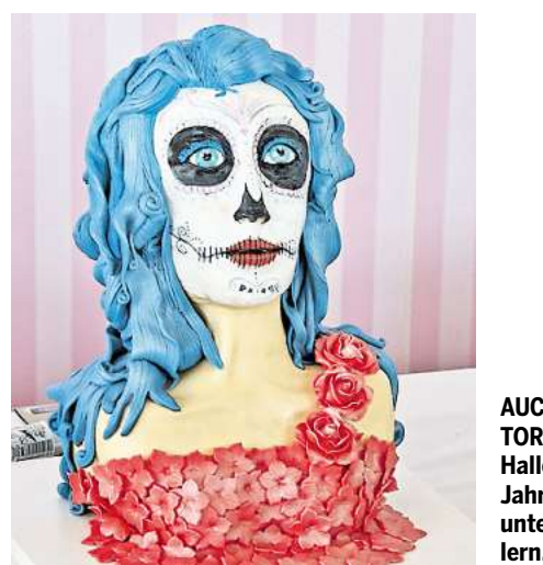
AUCH DAS IST EINE TORTE: Das Thema Halloween ist dieses Jahr ein großer Trend unter den Tortenkünstlern.