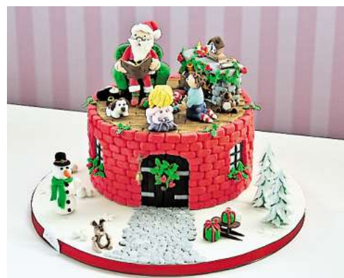
ALLES ESSBAR: Diese Weihnachtstorte ist fast zu schade zum Anschneiden.