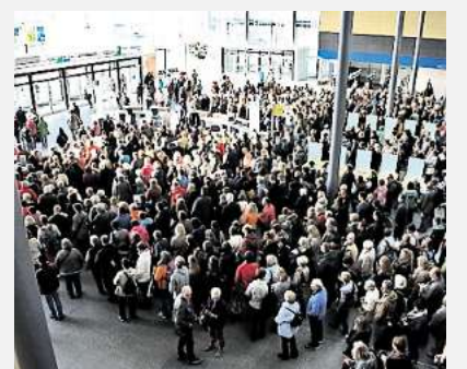
VIEL LOS: Am ersten Infa-Wochenende gabs einen Ansturm aufs Messegelände.

➔ Mehr Infos und alle Termine unter: www.meine-infa.de